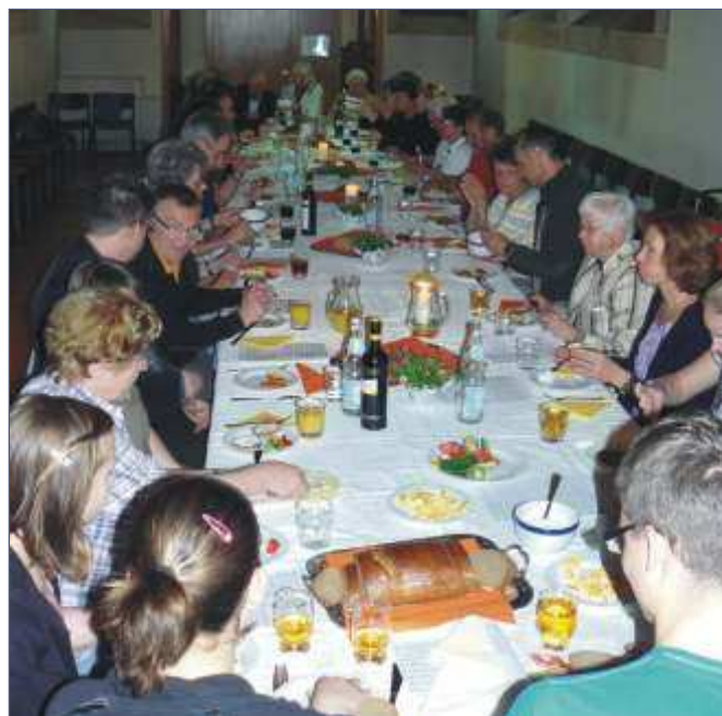
Nach der Abendmahlsfeier blieb die Gemeinde zum Abendessen zusammen