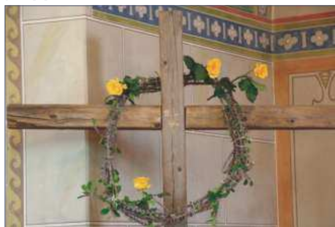
Während des Jubiläumsgottesdienstes wurde ein Holzkreuz mit Dornen und Rosen geschmückt.

Ich möchte nicht unterschlagen, dass unserer Kirche vor dem Gottesdienstbeginn eine Plakette