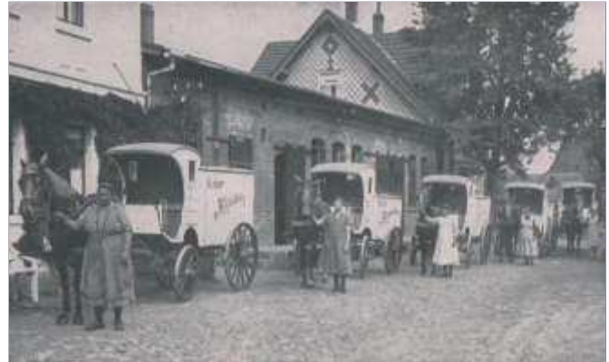
Wagenpark der Kindermilchstation Lehndorf