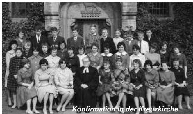
Konfirmation in der Kreuzkirche

Schon früh am Morgen machte ich mich auf von Osterode – am Südharz gelegen – nach Braunschweig-Lehndorf zu dem Ort, in dem ich einen großen Teil meiner Jugend verbrachte. Was wird mich erwarten? Wen werde ich wiedersehen? Sind meine alten Freunde von damals da? Viele Erinnerungen waren plötzlich wieder da!