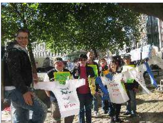
Protestaktion September 2010